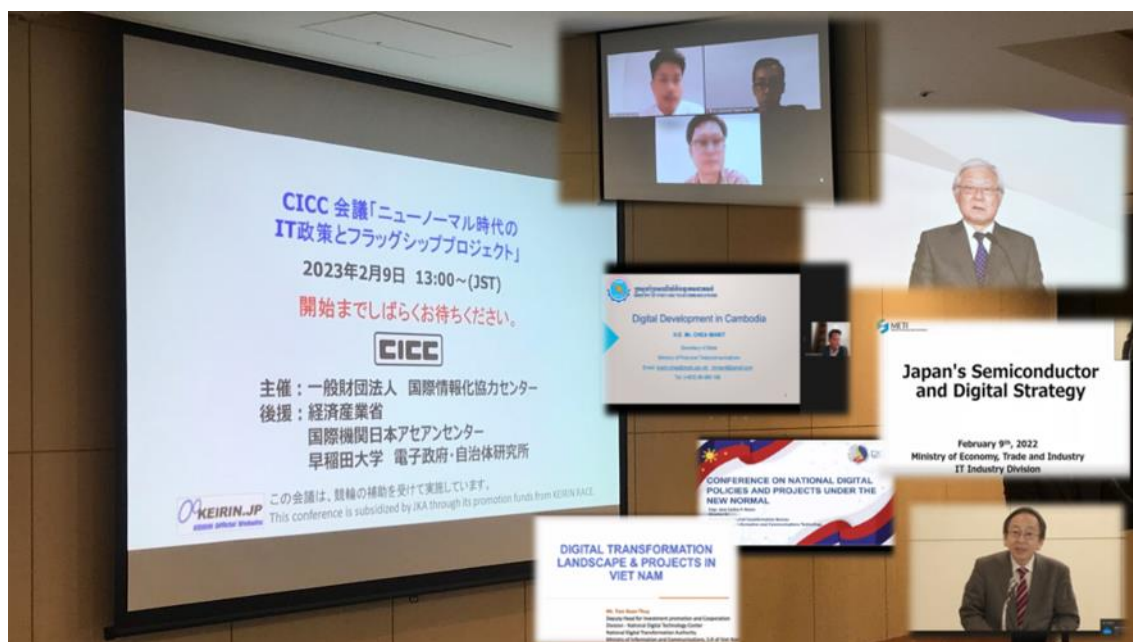
写真 オンライン会議の様子

IT政策やプロジェクトの動向を相互に理解するため、我が国の他、ブルネイ、カンボジア、ラオス、フィリピン、タイ、ベトナムの東南アジア6カ国の計7カ国をオンラインで接続し、2023年2月9日に「ニューノーマル時代のIT政策とフラッグシッププロジェクト」会議を開催して、7カ国のIT関連の政府要人から各国のデジタル政策やプロジェクトの現状や計画を発表いただき、有意義な情報共有、意見交換をすることができた。